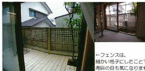
←フェンスは、細かい格子にしたことで周囲の目も気になりません！