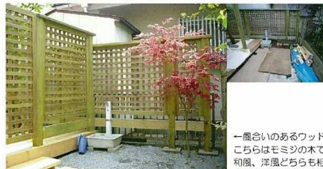
←風合いのあるウッドデッキ。こちらはモミジの木ですが、和風、洋風どちらも相性はばっちりです。