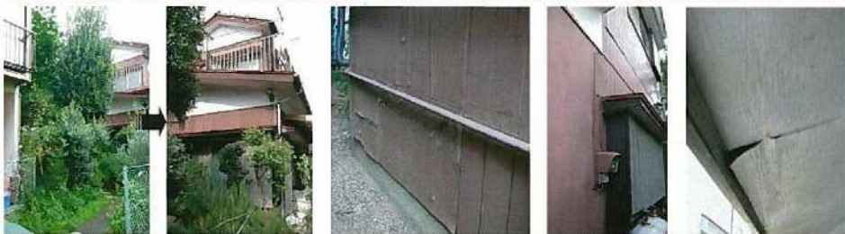
木が茂って家の周りの庭木がスッキリ剪定されると・・・

おまけに、「昨年、他業者で耐震金物を取り付けて安心していたわ～」と奥様のお言葉。通し柱が腐って無い家に、耐震金物を取り付けてしまう業者のモラルにビックリです！通し柱と土台を補修して、太いスジカキをX型に取り付けて、端部は耐震金物でガッチリと固定しました。外壁も綺麗に塗装し、これで一安心です。