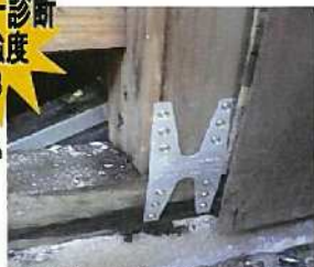
土台と新しい通し柱をしっかり固定して、外壁材を貼りきれいに塗装すると、まるで何もなかったかのようです！