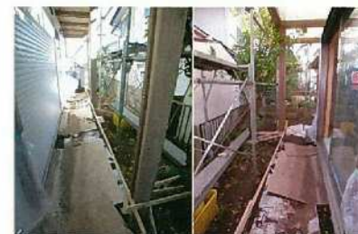
以前からのミカンはそのままで。