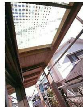
2階ヘランダの床からの採光がたっぷり入るように、屋根に工夫されています。