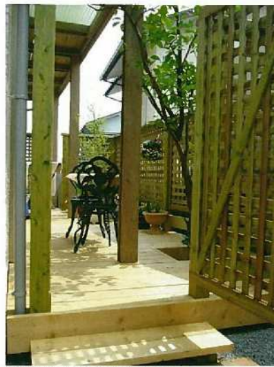
リビングとひと続きのような、広がりのある空間ができました。