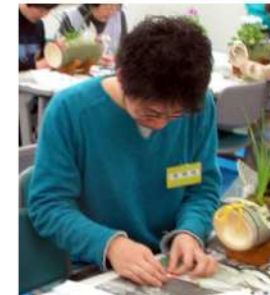
久しぶりの 折り紙 に真剣 そのもの!