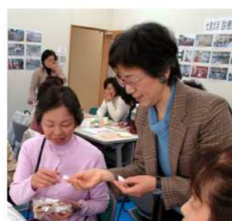
抽選会の様子です!