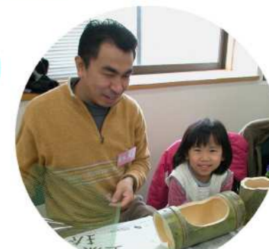
子供達も頑張りました!