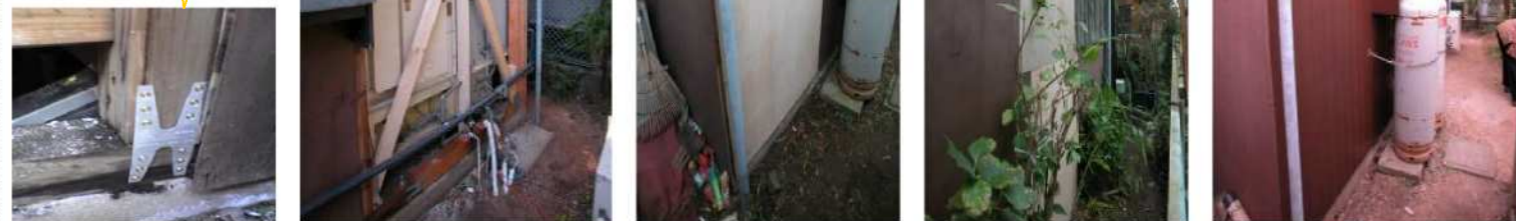
新しい柱を土台としっかり固定。