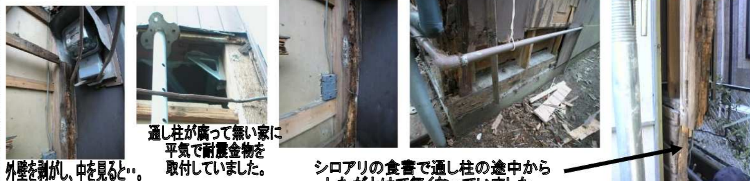
外壁を剥がし、中を見ると...